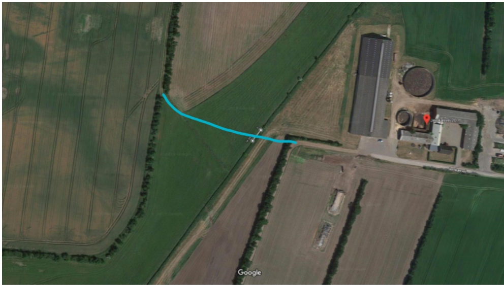
Figur 1: Oversigtskort med projekteret placering af rørbro samt fast vej (blå streg)

Grunden til etablering af overkørslen, er at man vil spare 4 km kørsel med traktor, gennem bebygget område. Dette svarer til mellem 150-220 store læs gylle (græs/maj m.m.) om året fra ca. 40 ha jord.